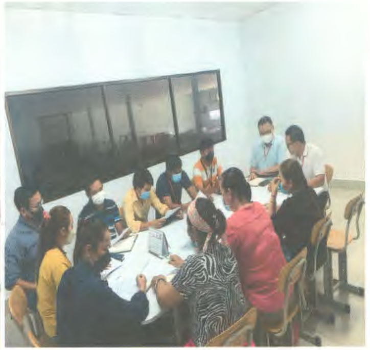
17 Mar 2023 at 1:02:33 PM