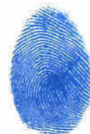
លោកស្រី ពេន ប្រើច