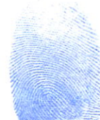
បេង ស្រីនាង