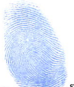
ពាន ឌុស្សាហ៍