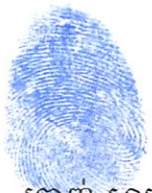
ក្រាញ៉ូ សារ៉េន