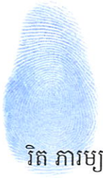
វិត ភារម្យ