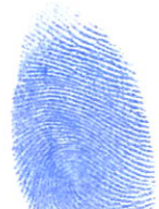
ស្រៀង ណាតា