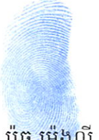
ប៉ូច ម៉េងលី