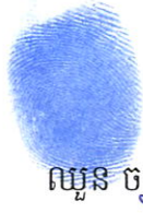
ឈួន ចន្ទី