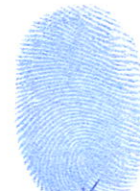
ស៊ីង ភាក់