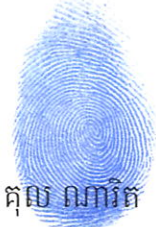
គុណ ណារីត