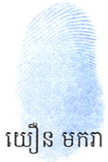
យ៉ឿន មកកា