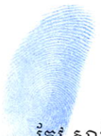
កែវ សារ៉ុម