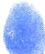
គឹម សាលីន