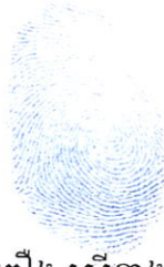
កៀង ស្រីនាង