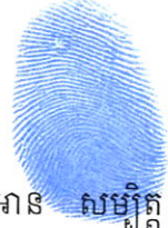
អាន សម្បិត្ត